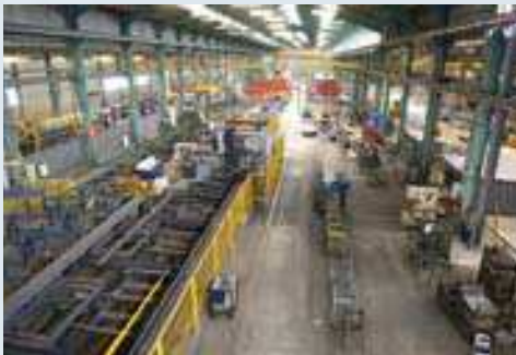
Site de Varades