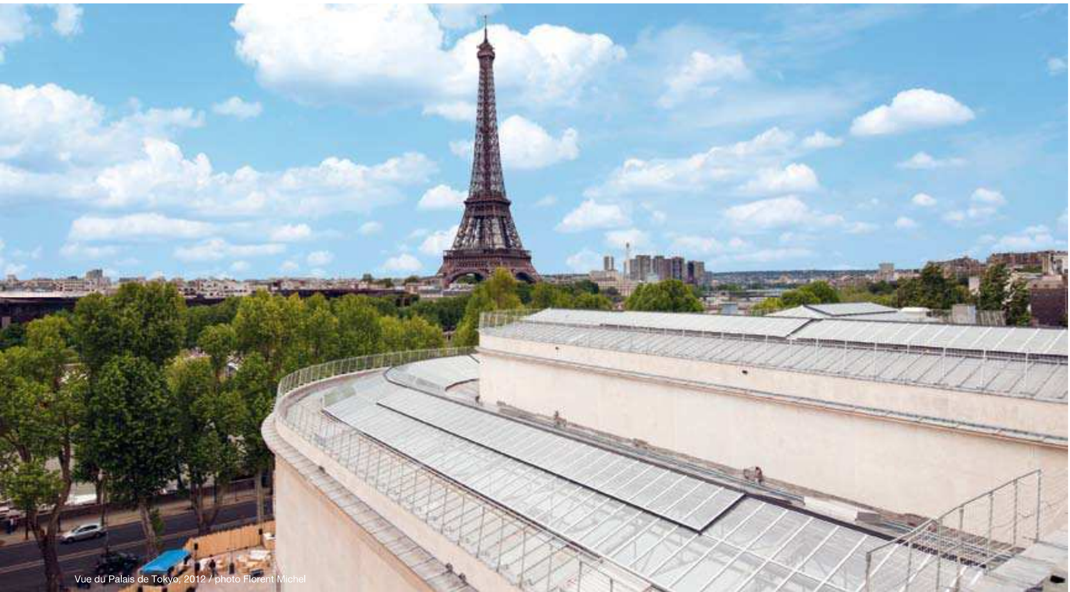
Vue du Palais de Tokyo, 2012