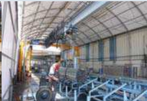
Site de Monteux