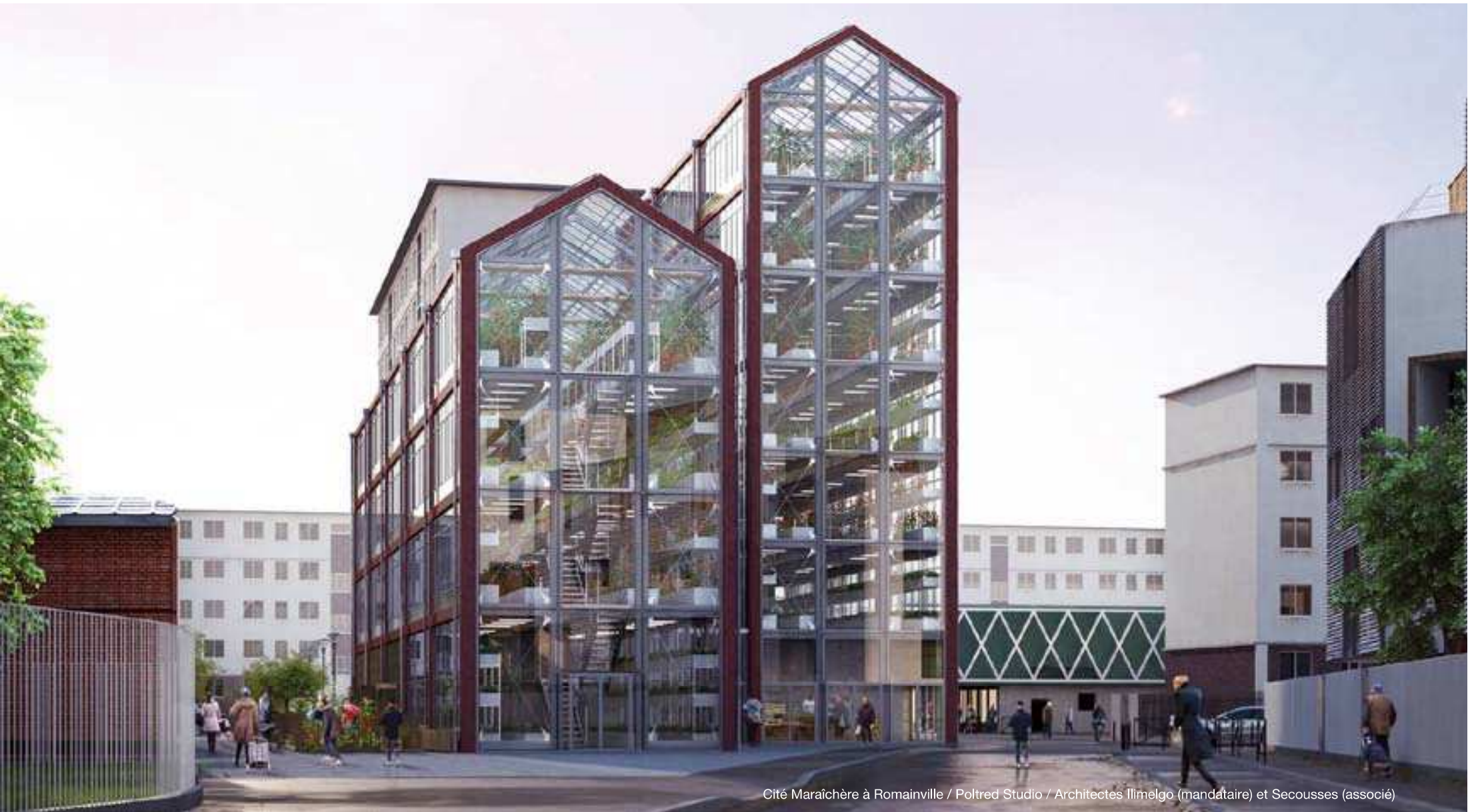
Cité Maraîchère à Romainville / Poltred Studio / Architectes Ilmelgo (mandataire) et Secousses (associé)